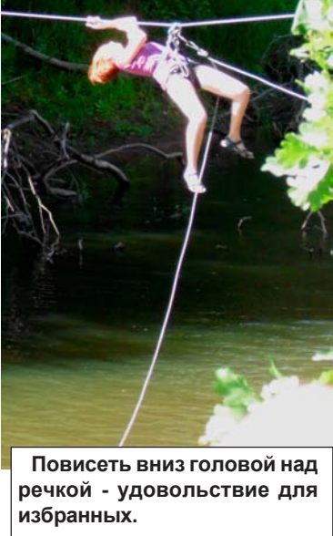
Повисеть вниз головой над речкой - удовольствие для избранных.