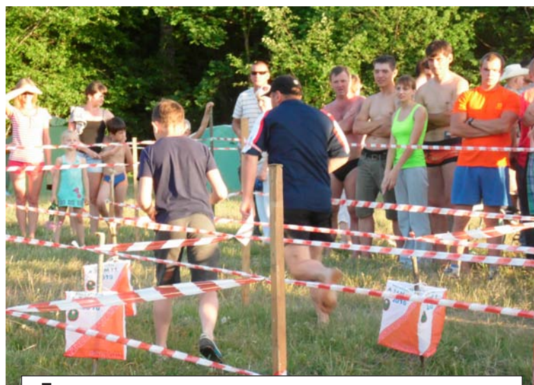
Только со стороны кажется, что преодолеть полосу препятствия - пара пустяков. Попробуйте на досуге!