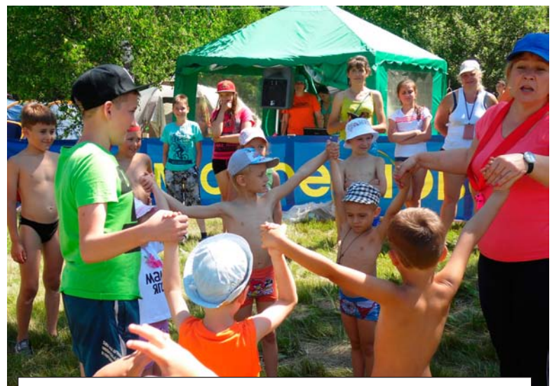
Дети туристов - особенные. Надо успеть и за родителей поболеть, и поиграть, и в конкурсах поучаствовать

Также прошли соревнования, которые выявили мастерство собравшихся команд – «Туристичес-