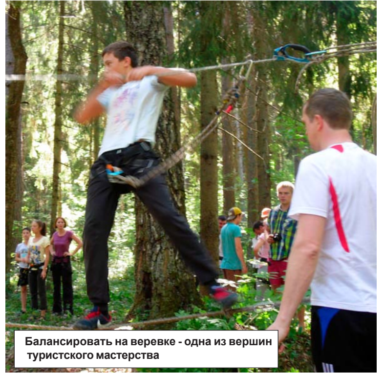
Балансировать на веревке - одна из вершин туристского мастерства